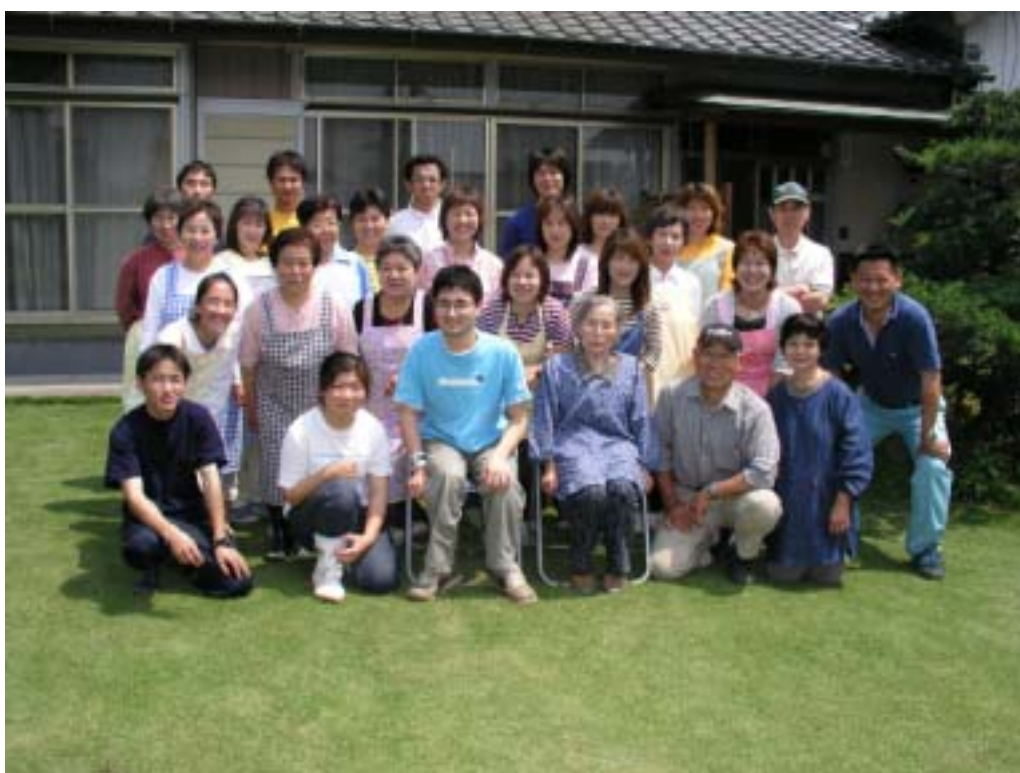
(こんな仲間働いています)