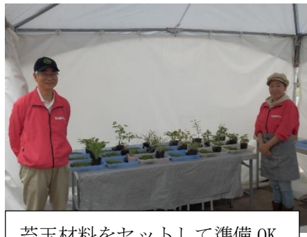
苔玉材料をセットして準備OK