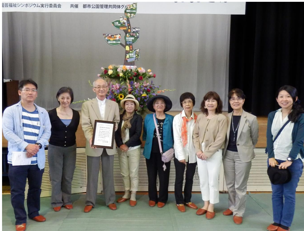
<NPO 法人 日本園芸福祉普及協会より顕彰を受ける：園芸福祉シンポジウム in おおさか会場にて>