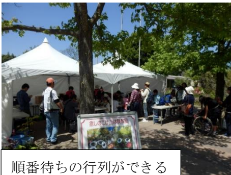
順番待ちの行列ができる

◇5月4～5日は、国営海の中道海浜公園で「癒しのこけ玉づくり体験教室」を実施しました。