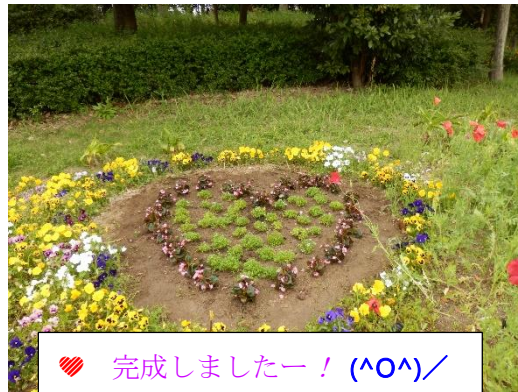
🌱植え付けを楽しむ