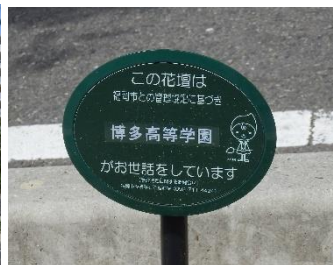
最近の花壇の景です。