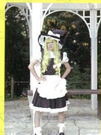
「ビビコス」当日の様子