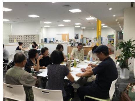
定例会の様子