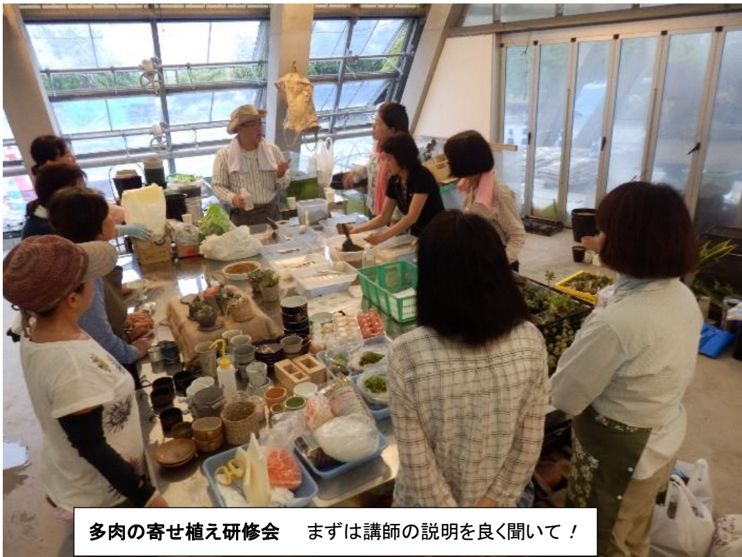
多肉の寄せ植え研修会 まずは講師の説明を良く聞いて！