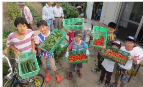
朝取り夏野菜がおみやげだ