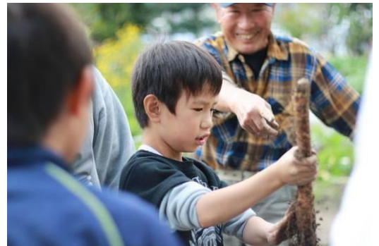
じねんじょ折れずに取れた！