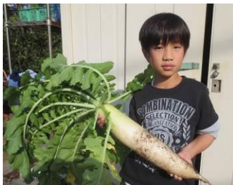
大根の葉っぱも食べるよ

落花生が土の中にできて、採れたてをゆでて食べるとすごくおいしいことも知りました。じねんじょは、土の奥深くまでのびるとしゅうかくしにくくなるので、土の中にトイやビニールシートをしいて、その上にじねんじょを植えてしゅうかくしやすくする工夫も習いました。じねんじょのつるにできるムカゴで作る「ムカゴごはん」はお父さんの大好物です。畑でしゅうかくできるものは野菜だけでなく、家族やみんなの笑顔も収穫できる楽しい場所です。