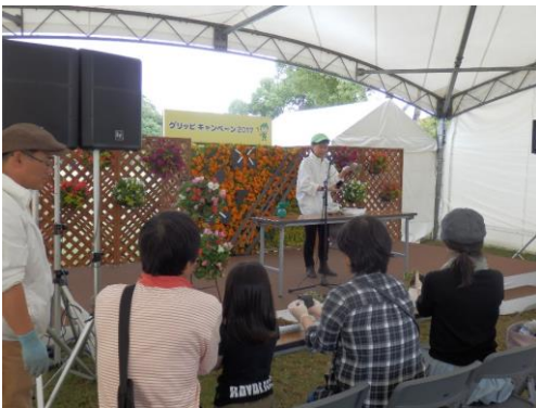
ステージイベント：苔玉づくり

コケを糸で巻きコケ玉が完成すると緊張がほぐれたのでしょうか。皆さん満面の笑顔になられ、テント内は和やかな雰囲気になっていきました。