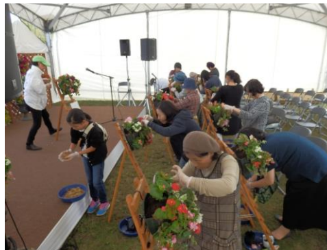
ハンギングバスケットづくり体験